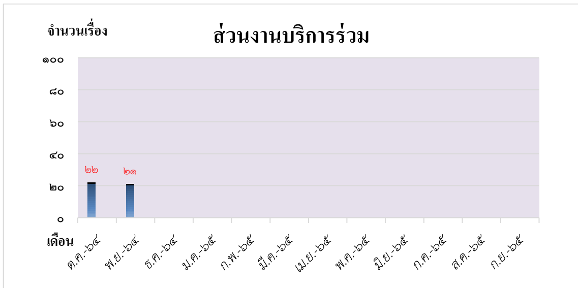
กราฟแสดงปริมาณส่วนงานบริการรวม